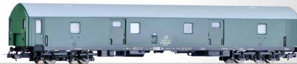
Bahnpostwagen, Typ Y, der Deutschen Post (Längenmaßstab 1:100) Mail wagon, type Y, of the Deutschen Post (length scale 1:100)