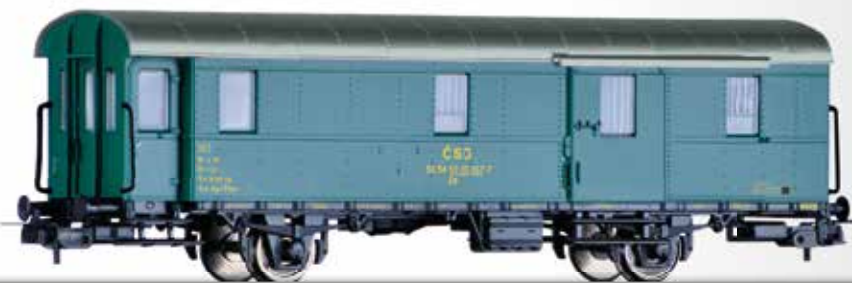
Packwagen Dd (ex. Pwi-31a) der ČSD Baggage car Dd (ex. Pwi-31a) of the ČSD