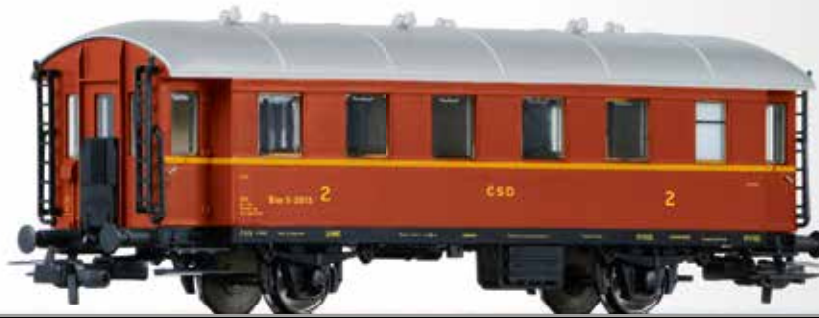
Beiwagen 2. Klasse Bim (ex. Ci-33) der ČSD 2nd class trailer car Bim (ex. Ci-33) of the ČSD