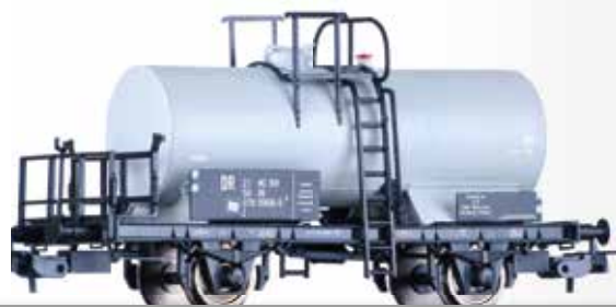
Kesselwagen Z "VEB Chemische Werke Buna", eingestellt bei der DR Tank car Z "VEB Chemische Werke Buna" of the DR