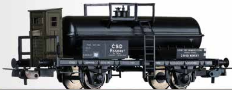
Säurekesselwagen R der ČSD Acid tank car R of the ČSD