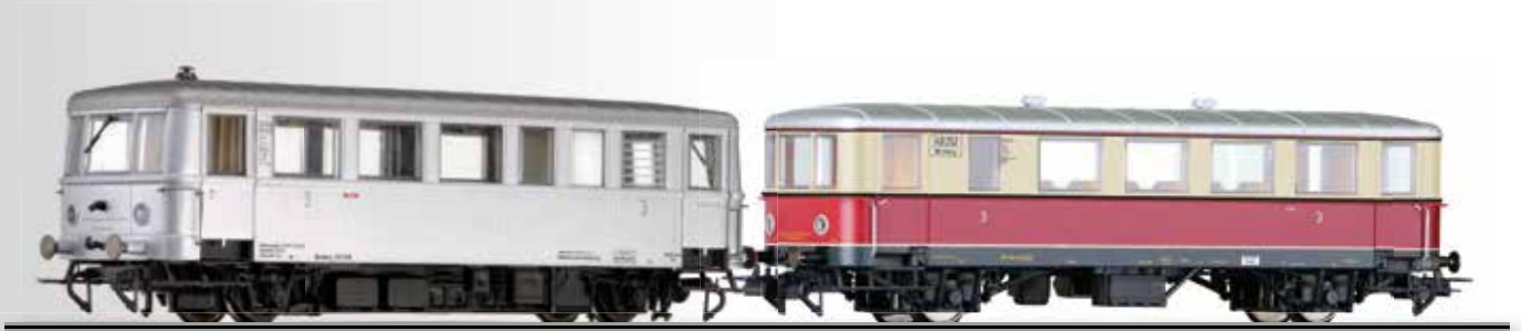
Triebwagen CvT 135 (Hydronalium) mit Beiwagen CPost v-35 der DRG Railbus class CvT 135 with trailer car CPost v-35 of the DRG