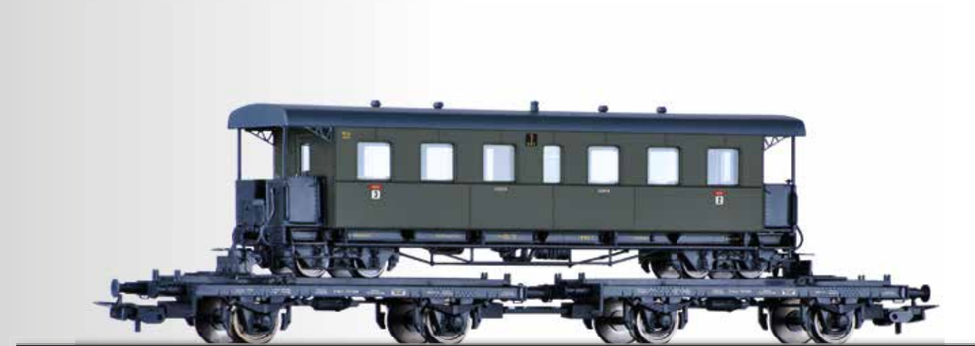
Set „Schmalspurtransport“ der DRG, zwei Schmalspur-Transportwagen H0, beladen mit einem Schmalspur-Personenwagen der NWE H0m Narrow gauge set of the DRG with two transport cars H0, loaded with one narrow gauge passenger coach of the NWE H0m