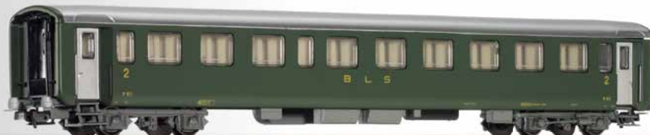
Reisezugwagen 2. Klasse, Bauart Schlieren, der BLS 2nd class passenger coach, type Schlieren, of the BLS